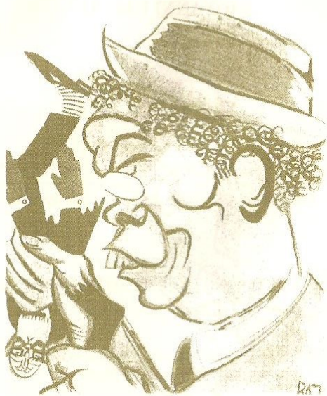
Caricatura di Bazzi 1920