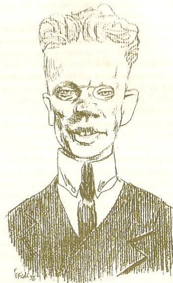
Disegno di Pericoli 1992