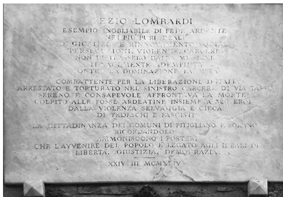
Lapide posta sulla casa di Crispino Lombardi a San Quirico